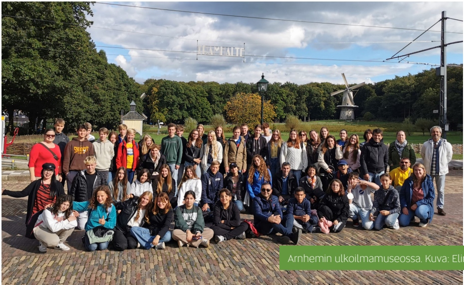
Arnhemin ulkoilmamuseossa.

Isäntäperheemme ottivat meidät lämpimästi vastaan Amsterdamin lentokentällä, josta on vajaan tunnin ajomatka Culemborgiin. Ajomatalla saattoi ihastella Culemborgin kaunista maalaismaisemaa ja arkkitehtuuria.