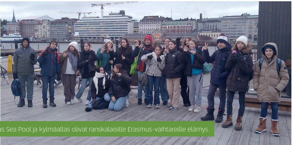
Allas Sea Pool ja kylmäallas olivat ranskalaisille Erasmus-vaihtareille elämys.

Oodi hurmaa poikkeuksetta kaikki vaihtoporukat, niin nämä La Rochellesta tulleet peruskoululaisetkin. Yksi viikon jännittävimpiä ja pelätyimpiä ohjelmanumeroita oli vierailu Allas Sea Poolissa. Vierailu oli suurmenestys, sillä innokain kävi kylmäaltaassa kuusi kertaa.