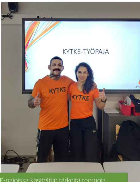
KYTKE-pajoissa käsiteltiin tärkeitä teemoja