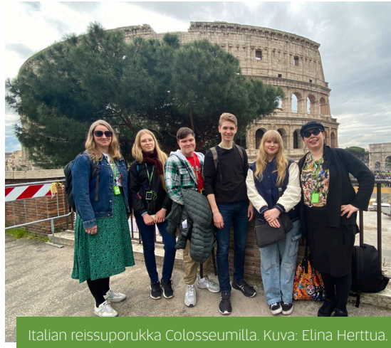
Italian reissuporukka Colosseumilla.

Koululla oli tervetuliaisseremonia, ja jo silloin opimme, että aikataulut ja suunnitelmat tulisivat muuttumaan koko ajan. Opiskelimme hetken aikaa tekijänoikeuksista ja sitten pelasimme koripalloa.