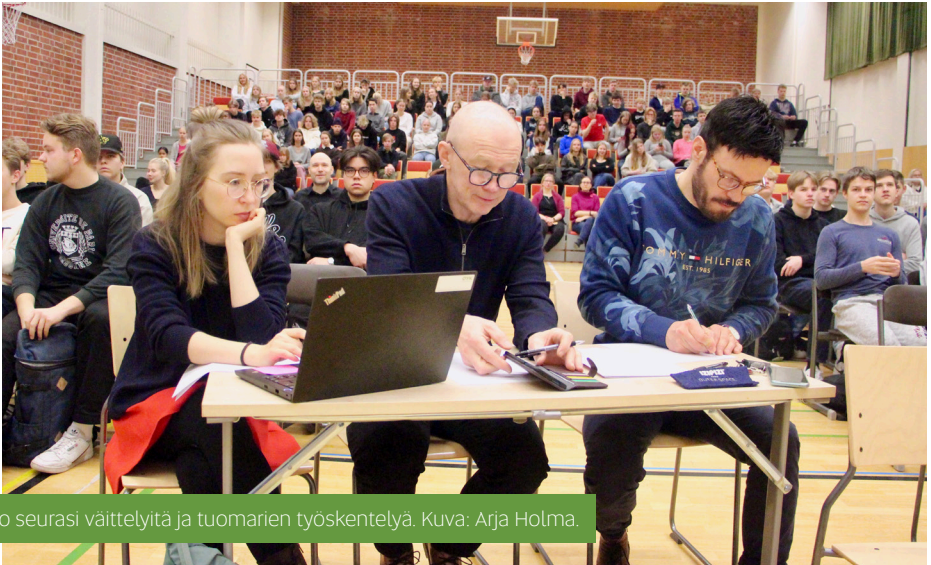
Koko lukio seurasi väittelyitä ja tuomarien työskentelyä.