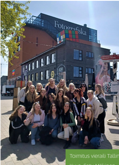
Toimitus vieraili Tallinnan Fotografiskassa.

O´Timesin toimitus ei myöskään ole päässyt paistattelemaan kirjoitustaidoillaan parrasvaloissa aivan yksin, sillä tekstien joukosta löytyy myös vierailevilta tähdiltä muun muassa esseitä, puheita sekä kirjoitustaidon tekstejä. Näitä kaikkia pääsee lukemaan netistä osoitteesta issuu.com/otimes ja lisäksi lehden paperiversioita löytyy koululta.