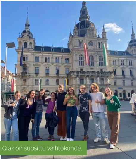
Itävallan Graz on suosittu vaihtokohde.

kk:n vaihdot toteutamme yleensä vastavuoroisuusperiaatteella eli matkaan lähtevä nuori si- toutuu majoittamaan ulkomaisen nuoren.