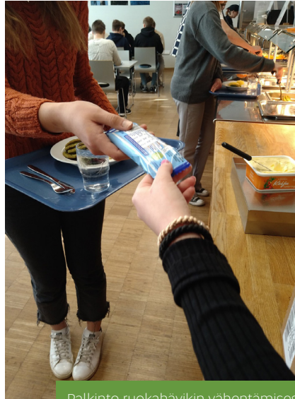
Palkinto ruokahävikin vähentämisestä

Yläkoulun ja lukion yhteisen ympäristöryhmän toimintaa lukuvuoden aikana on ohjannut tavoitteellinen Vihreän lipun jatko projekti, jonka aiheeksi valikoitui ”Luonnon moninaisuus”. Teemaan liittyen ryhmäläiset muun muassa istuttivat koulun pihanurmikolle syksyllä kukkasipuleita, joiden kukintaa olemme saaneet jo ihastella tämän kevään aikana. Ympäristöryhmä on osallistunut koulun eri tilaisuuksiin: esimerkiksi vappuna ryhmä järjesti jätelajittelukilpailun. Osallistujia oli jonoksi asti, suurin osa jättekuvakorteista päätyi oikeisiin jakeisiin ja palkintotikkarit parempiin suihin. Ruokalan kanssa yhteisenä projektina on ollut ruokahävikin vähentäminen, johon ryhmä osallistui tehden tiedotteita ja päivänavauksen. Vihreän lipun teemaa ja koulun ympäristötavoitteita on tehty näkyväksi koko kouluyhteisölle ryhmäläisten päivänavauksien, tiedotteiden ja sosiaalisen median kautta. Myös lukion O’Times-lehdessä on ollut ympäristöasioihin liittyviä artikkeleita.