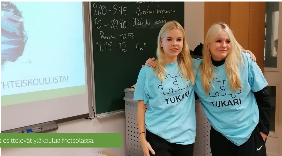
Tukarit esittelevät yläkoulu Metsolassa.

Koulullamme on järjestetty myös kerhotoimintaa. Iltapäivisin järjestettävät liikunta- ja näytelmäkerhot ovat olleet suosittuja.