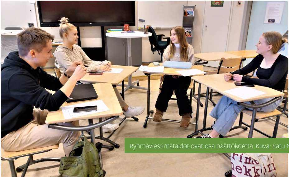
Ryhmäviestintätaidot ovat osa päättökokeita.

Puheiden jälkeen koitti ryhmäkeskustelujen vuoro. Keskusteluaiheet toimitettiin meille juhlallisesti kirjekuorissa, joiden avaamisen jälkeen oli kaksikymmentä minuuttia aikaa tehdä itsenäistä taustatyötä keskustelua varten. Itse keskustelu kesti vartin, jonka aikana tehtävänanto tuli käydä monipuolisesti läpi ja päätyä sitten