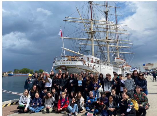
Itämerellistä tunnelmaa Gdynian kaupungissa.

Rajoitusaikojen hellitettyä viime keväänä saimme palauttaa takaisin koulumme arkeen ihanat kansainvälisyyskohtaukset. Yläkoulun Erasmus-projektimme Digital Challenges - Unlock the Escape Room! ensimmäinen projektimatka tehtiin Barcelonaan maaliskuussa 2022, ja heti toukokuussa vuorossa oli Gdansk. Tänä lukuvuonna olemme olleet syyskuussa Culemborgissa, marraskuussa Tarsoksessa ja huhtikuussa Iserniassa. Projektimme kumppanuusmaat Espanja, Puola, Hollanti, Turkki ja Italia ovat tarjonneet projektiin osallistuville yhdeksäsluokkalaisille unohtumattomia kulttuurielämyksiä ja uusia ystävyksiä. Projektimatkoilla on kuljettu 4–5 suomalaisoppilaan ja kahden opettajan voimin tutustuen vastaavaan joukkoon viidestä muusta