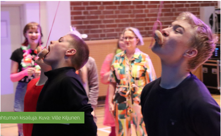
Vapputapahtuman kisailuja.

Lokakuussa 2022 järjestimme koko koululle halloween-tapahtuman. Järjestelimme tapahtumaa useassa kokouksessa ennen halloweena. Tapahtuman järjestämiseen osallistui aktiivisesti edustajia.