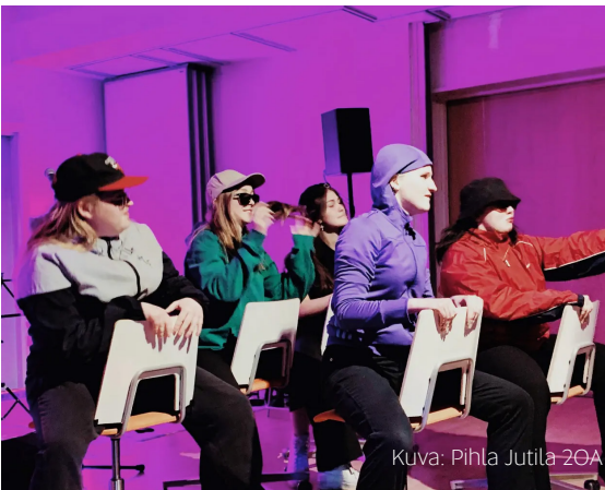
Kuva: Pihla Jutila 20A

Torstaina 17.11. järjestettiin lukusalissa OYK:n historian ensimmäinen lukion esittävän taiteen