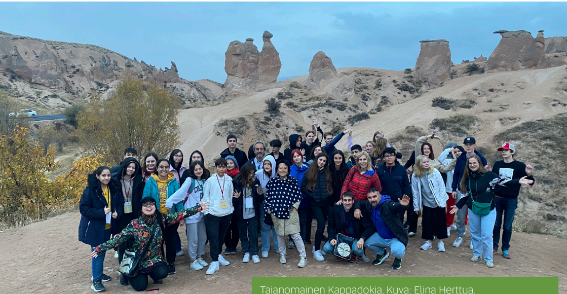
Taianomainen Kappadokia.