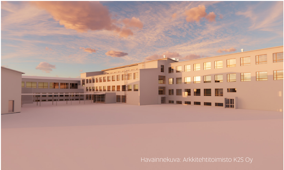
Havainnekuva: Arkkitehtitoimisto K2S Oy