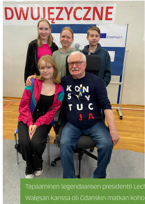
Tapaaminen legendaarisen presidentti Lech Wałęsan kanssa oli Gdańskin matkan kohokohta.

Melko vakavista aiheista huolimatta reissumme Gdańskiin oli todella kiva ja mukava. Saimme tavata Puolan entisen presidentin ja solidaarisuusliikkeen johtajan Lech Wałęsan, joka tuli esiintymään koululle. Saimme myös kysyä Wałęsalta kysymyksiä. Tutustuimme Gdańskiin kaupunkisuunnituksesta ja kävimme myös Gdańskin naapurikaupungeissa Sopotissa ja Gdyniassa. Vapaa-ajalla pääsimme shoppailun lisäksi käymään esimerkiksi papukajapuistossa ja akvaariossa. Kävimme yhdessä trampoliinipuistossa sekä lopetimme yhteisen reissumme keilaamiseen.