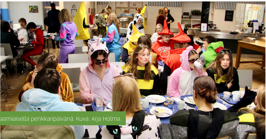
Abeja aamiaisella penkkaripäivänä.

Breikki tuntee vastuullisuutta ilmastoasiassa. Ruokapalvelujen tuottajana Compass Group tuntee ruoantuotannon ja elintarvikkeiden aiheuttaman ympäristökuorman. Poisheitetyn ruoan ongelma ei niinkään ole syntyvä biojäte tai ruoan päätyminen sekajätteen joukkoon, vaan kyse on ruokatuotannosta aiheutuneista ympäristörasituksista. Kouluravintola Breikki tekee jatkuvasti työtä Compass Groupin kanssa hävikin määrän pienentämiseksi kehittämällä ostoja, työtapoja ja valikoiman suunnittelua. Seuraamalla hävikkiä säännöllisesti Breikissä pystytään mitoittamaan valmistetun ruoan määrää ja ostojen raaka-aineiden hankintaa.