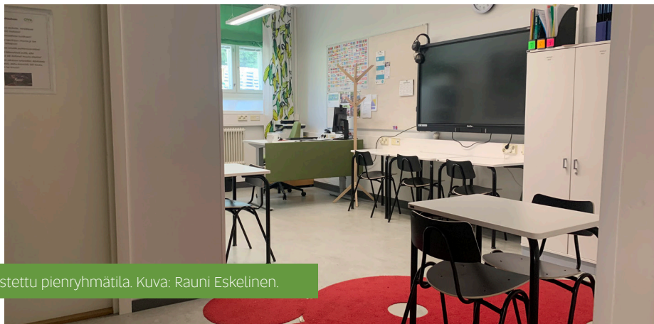
Uudistettu pienryhmätila.