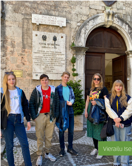
Vierailu Isernian kaupungintalolla.