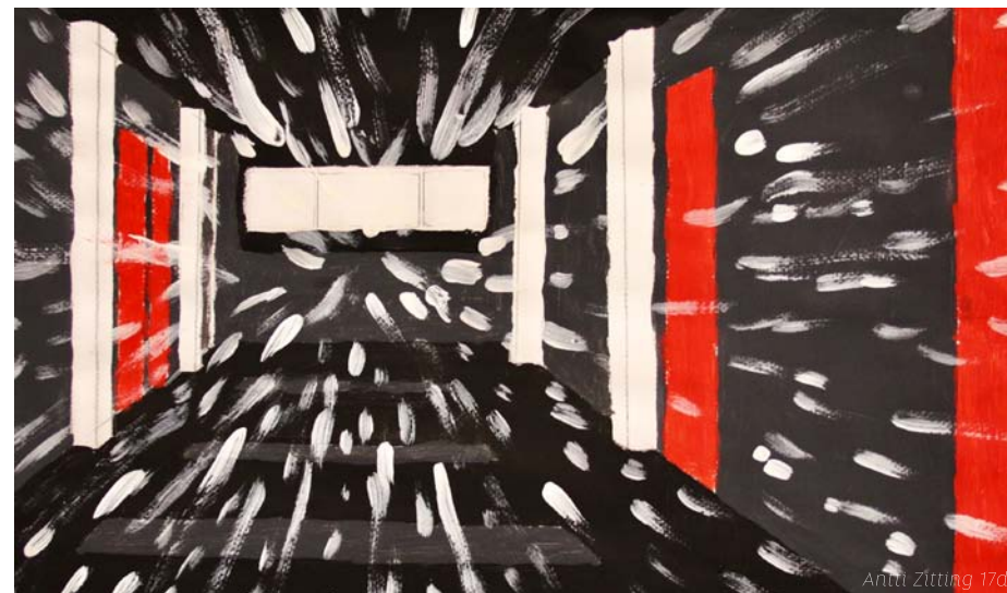
Antti Zitting 17d