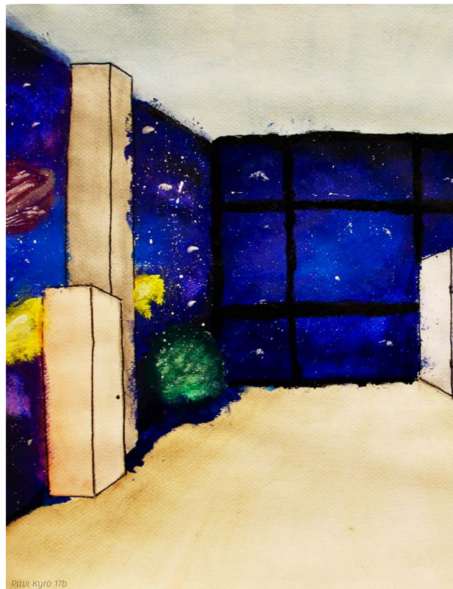
Piltvi Kyrö 17b

Mikäli et halua nimeäsi tiedotusvälineissä julkaistaviin uusien ylioppilaiden luetteloihin, ilmoita siitä kirjallisesti kansliaan ennen yo-kirjoitukseen osallistumista.