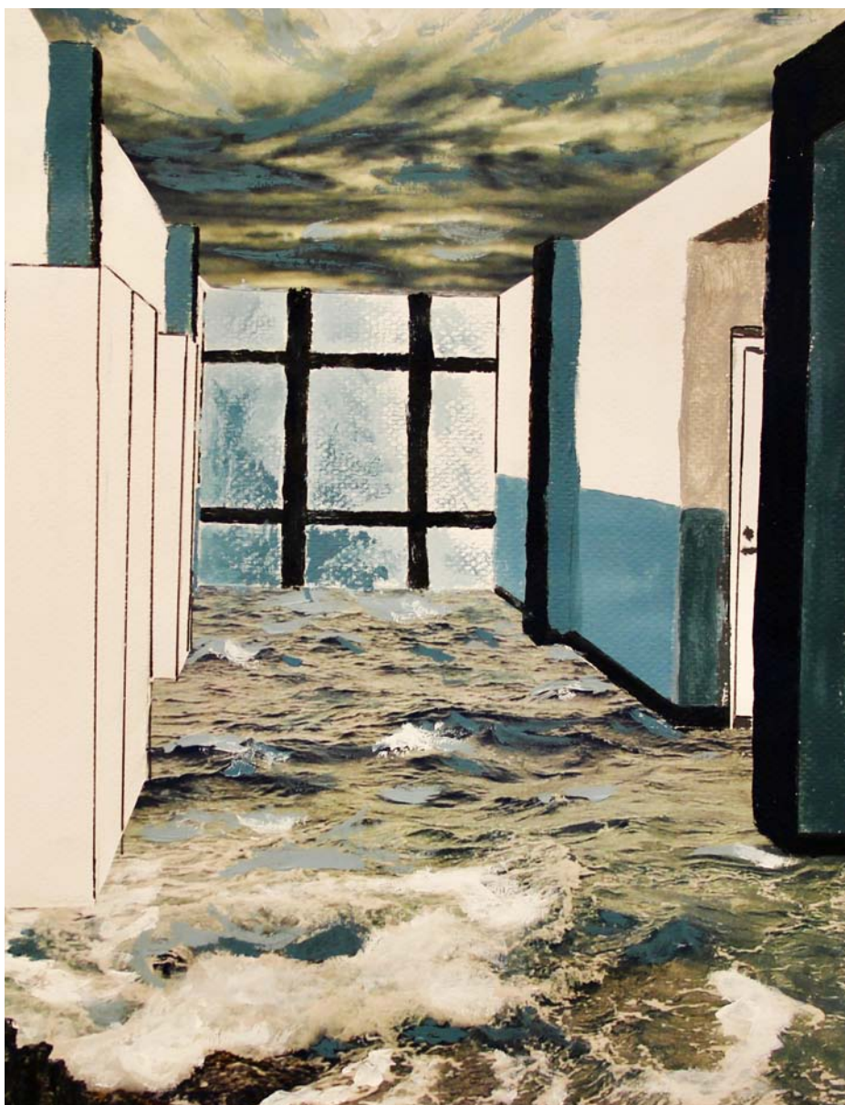
Ulpu Vuori 17d