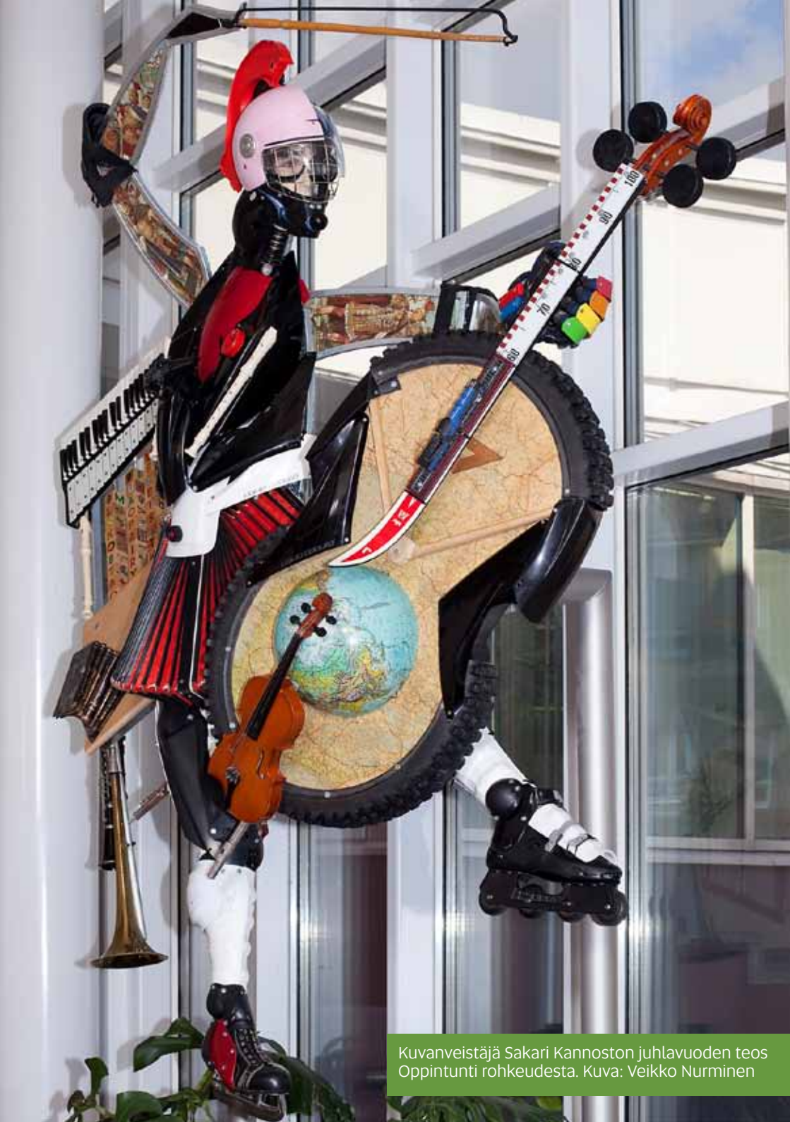
Kuvanveistäjä Sakari Kannoston juhlavuoden teos Oppintunti rohkeudesta.