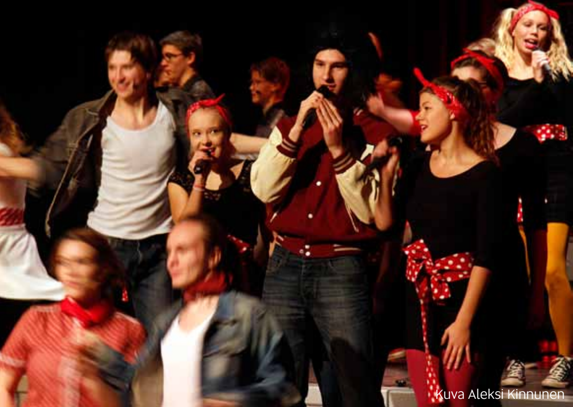
Kuva Aleksi Kinnunen

Musikaalin teemana oli juhluvuoden kantavaa teemaa mukaillen nuoruus. Lähes puolitoistatuntinen kokonaisuus oli läpileikkaus koulun historiasta 90 vuoden ajalta. Yleisö pääsi seuraamaan ilotulitusta eri vuosikymmeniltä: 20-luvun pukuja ja tanssia, ylistystä 50-luvun ihmejuomalle, Coca-Colalle, sotavuosien synkkiä sävyjä, 70-luvun mustahuulisia punkkareita ja lopulta myös 2000-luvun nykynuorisoa selfieineen ja pissiksen elkeineen. Kaiken keskiössä oli nuoruus ja kunkin vuosikymmenen nuorisokulttuuri.