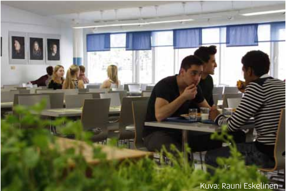
Kuva: Rauni Eskelinen