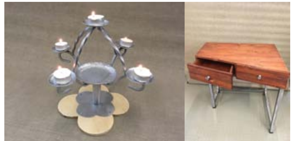
NEEA KAIJANRANTA 8G JA MIKKO SUOMI (9D, 2018)

Koulukohtainen työpäivä 12.1.2019 (la) Talviloma vk 8 18.2.2019 (ma) - 22.2.2019 (pe) Pääsiäsiloma 19.4.2019 (pe) - 22.4.2019 (ma) Vapaa vapunpäivä 1.5.2019 (ke) Vapaa helatorstai 30.5.2019