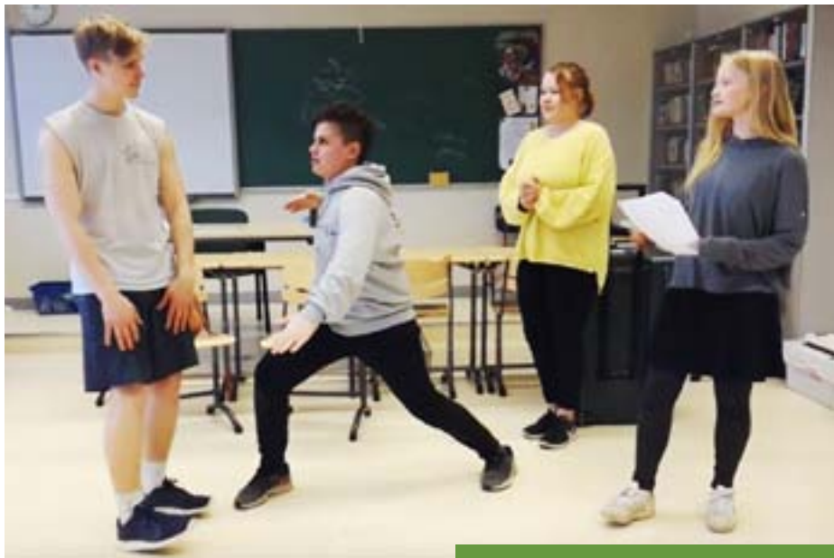
Tässä harjoitellaan absurdia muunnelmaa Beckettin absurdin näytelmän pohjalta.