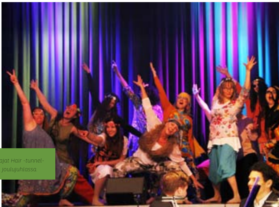
Opettajat Hair -tunnelmissa joulujuhlissa.