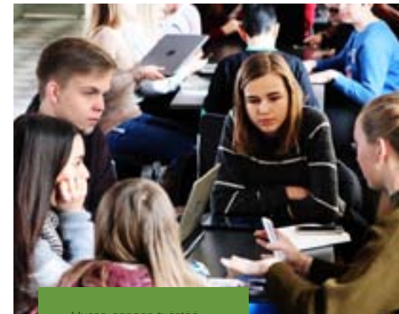
Museo-oppaan työstöä kansainvälisissä ryhmissä

Istuin rantakahvilassa syömässä pistaasijäätelöä. Kuulin aaltojen rytmikkäät iskut sekä naurua ja