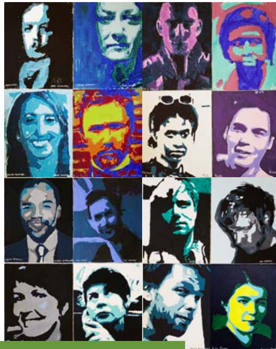
Eri alojen suomalaisia vaikuttajia oppilaiden poptaidemaalauksina