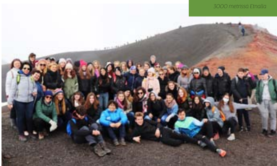
Erasmus-porukka 3000 metrissa Etnalla

Oon aina mielenkiintoista tutustua uuteen kulttuuriin ja matkustaa ulkomaille. Käyntimme Sisiliassa oli myös ensimmäinen matkani Italiaan, jonne