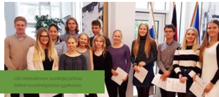
DSD-kielitutkinnon suorittajia juhlissa Saksan suurlähetystössä syyskuussa